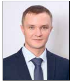
Артём СПИРИН Фото автора

Будьте начеку. На 3-й день знакомства Джек первый раз получил от бабы Муры по морде. Ваше постоянное присутствие повышает вероятность не допустить серьёзных последствий.