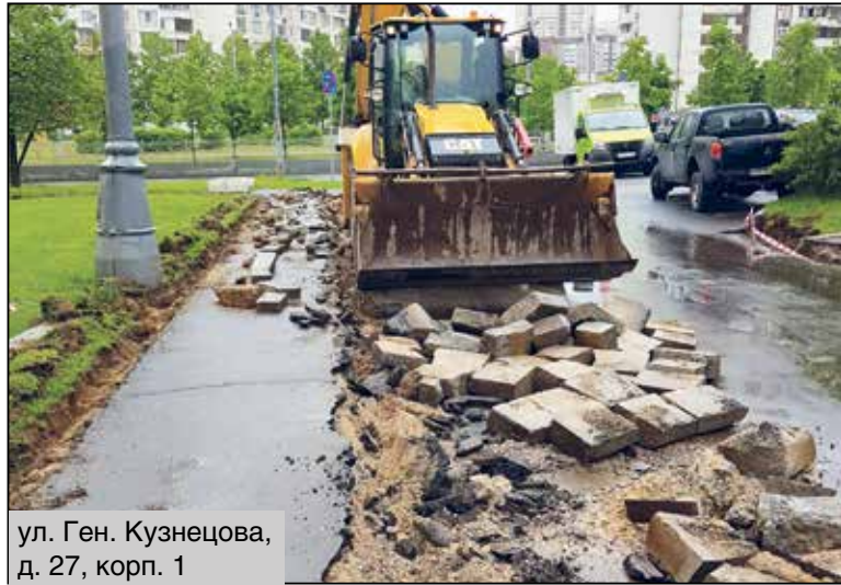
ул. Ген. Кузнецова, д. 27, корп. 1

«Идите по денежному следу», – говорил «Глубокая глотка», под псевдонимом которого прятался Марк Фелт, заместитель директора ФБР, расследующий Уотергейтский скан-