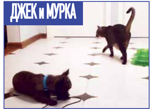
ДЖЕК И МУРКА

ДЕНЬ 3. Баба Мура уменьшает дистанцию, однако терпеть резкие движения Джека не намерена.